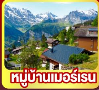
หมู่บ้านเมอร์สเรน