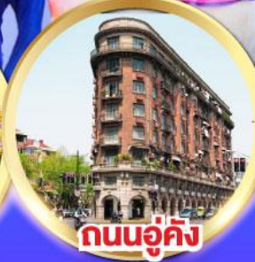
ถนนอู่คัง