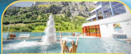
แช่น้ำแร่ร้อนฟ่อนคลายลอสยคอร์บิค