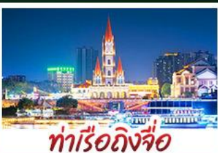
ท่าเรือกิ่งจื่อ

เขาชิงช้าสวนดอกไม้ตามฤดูกาล หมู่บ้านสไตล์ยุโรปเที่ยงยวี่ มังซิง เสี่ยวจิ้น ถนนคนเดิน NANNING ZHIYE - เมืองโบราณไท่ผิง ท่าเรือกิ่งจื่อ - ถนนคนเดิน สามตรอกสองซอย