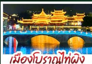
เมืองโบราณไท่ผิง