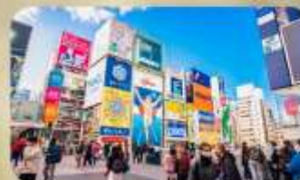
ซูปป์ิงซันโซบาชิ