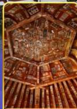
วัดซาชะเอโดะ