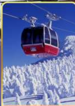
นั่งกระเช้าขึ้นเขาซาโอะ