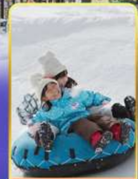
กิจกรรม ณ ลานสกี