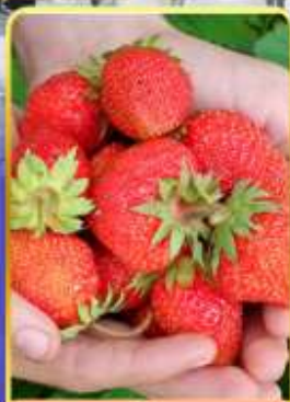
กิจกรรมเก็บสตอเบอรี่