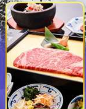
ROKKASEN พรีเมียม