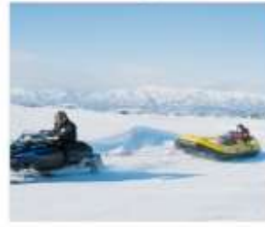
กิจกรรมบีโบสโนว์แลนด์