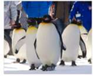
ชมพาเหรดแพนกวิน