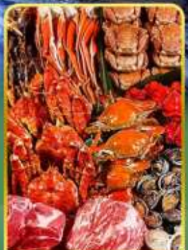
ปิ้งย่างพรีเมียมมันตะ