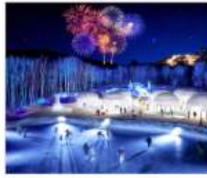
หมู่บ้านน้ำแข็งโทมามู