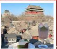
คาเฟ่ น้ำตาล