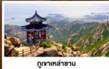
ภูเขาเหล่าซาน