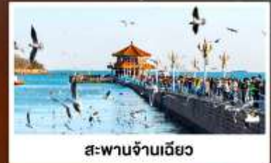
สะพานจ้านเฉียว