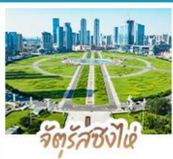
จัตุรัสชิงไผ่