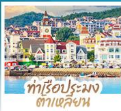
ทำเรือประมง ต้าเหลียน