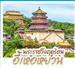
พระราชวังฤดูร้อน อี่เซวี่เฉวี่ยน

ทริปปเดียวเที่ยว 2 เมือง ปักกิ่ง-ต้าเหลียน • เที่ยวจิบฟีลยุโรป ณ เมืองวนิสแห่งต้าเหลียน • สัมผัสประสบการณ์ขึ้นกำแพงเมืองจีน ด่านจวียงกวน • ช้อปปิ้ง ซิม ซิล ที่ถนนโบราณตงกวนและย่านชานหลี่กุน