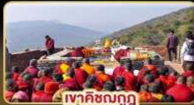
เขาคิชฌกูฏ