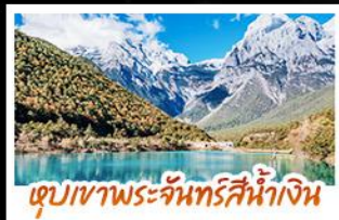
ทะเลสาบพระจันทร์สีน้ำเงิน