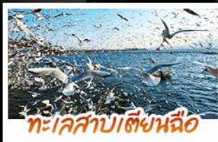
ทะเลสาบเตียนฉือ