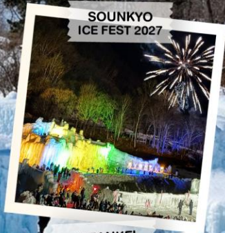
SOUNKYO ICE FEST 2027