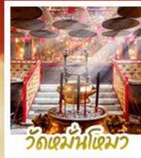
วัดหมื่นโหมว