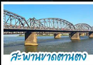
สะพานขาดตานตง