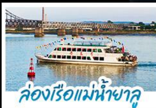
ล่องเรือแม่น้ำชาลู