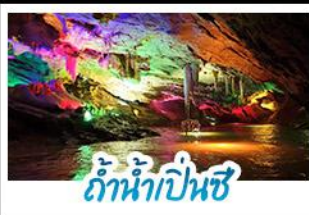
ลำน้ำปิ่นซี

แกรนด์เลี้ยวหนึ่ง 5 นคร...ชมวนิสต้าเลี้ยวสุดปัง เยือนชายแดนตงสุดขลัง ล่องแม่น้ำเป็นซีสุดอลัง ย้อนรอยวังเลี้ยวทุกกึ่ง