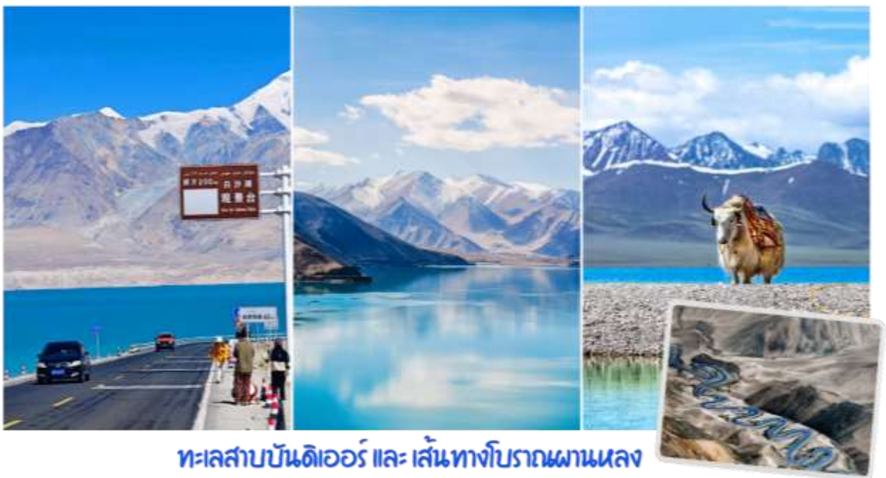
ทะเลสาบบันดิเออร์ และ เส้นทางโบราณผานหลง

นำท่านสู่ ถนนเส้นทางโบราณผานหลง (Panlong Ancient Road) ตั้งอยู่บนที่ราบสูงพามีร์ (Pamir Plateau) เขตเมืองทาชกูร์กัน (Taxkorgan) ทางตอนใต้ของเขตปกครองตนเองซินเจียงอุยกูร์ ประเทศจีน ถนนบนภูเขาที่คดเคี้ยวเลี้ยวลดอันตระการตาในเขตปกครองตนเองทาชกูร์กัน (Taxkorgan) ทางตอนใต้ของซินเจียง ประเทศจีน มีฉายาว่า "ถนนมังกรขด" ขึ้นชื่อเรื่องโค้งหักศอกกว่า 600 โค้ง บนภูเขาสูงชัน เป็นแลนด์มาร์กสำคัญสำหรับสายถ่ายภาพและคนรักการเดินทางที่ต้องการท้าทายฝีมือการขับขี่ ให้ทัศนียภาพที่สวยงามและแปลกตาของแนวภูเขาสูงชันและทะเลทรายในเขตซินเจียง จากนั้นนำท่านเปลี่ยนรถเป็นรถ 7 ที่นั่ง เพื่อเดินทางสู่ทะเลสาบบันดิเออร์ ทะเลสาบบันดิเอร์ (Bandir Blue Lake) หรือ อ่างเก็บน้ำเซียบันตี้ (Xiabandi Reservoir) เป็นทะเลสาบสีฟ้าครามใสบริสุทธิ์ที่ตั้งอยู่ท่ามกลางเทือกเขาพามีร์ ในเขตปกครองตนเองซินเจียงอุยกูร์ ประเทศจีน ขึ้นชื่อเรื่องวิวธรรมชาติที่สวยงามราวกับภาพวาดและน้ำสีฟ้าเข้มอันเป็นเอกลักษณ์จากการละลายของน้ำแข็ง น้ำสีฟ้าเทอร์ควอยซ์ตัดกับเทือกเขาสีน้ำตาลและท้องฟ้าสีคราม เป็นจุดถ่ายภาพที่ยอดนิยมในเส้นทางชมธรรมชาติบนที่ราบสูงพามีร์