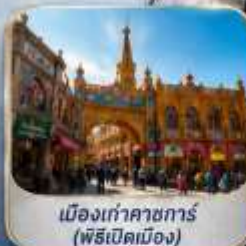
เมืองเก่าคาซการ์ (พิธีเปิดเมือง)