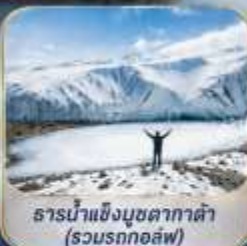
ธารน้ำแข็งมูซตาคาดา (รวมรถกอล์ฟ)