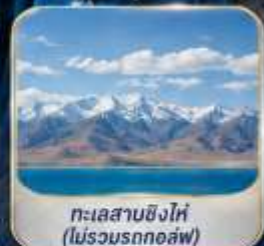
ทะเลสาบชิงไห่ (ไม่รวมรถกอล์ฟ)