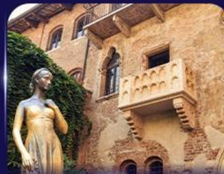
เขื่อนบ้านลูเลียต เวโรนา