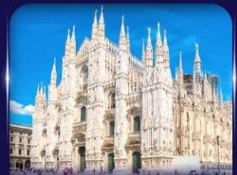
เซนต์มาร์กาเรต มิลาโน