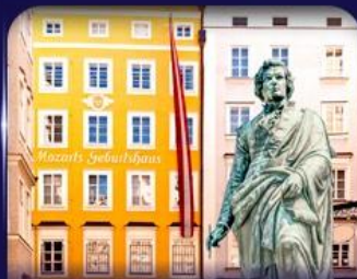
บ้านเกิดโมซาร์ท ซาลซ์บูร์ก