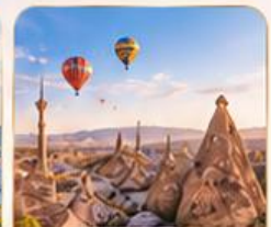
CAPPADOCIA คัปปาโดเกีย