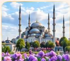
BLUE MOSQUE สุเหร่าสีน้ำเงิน