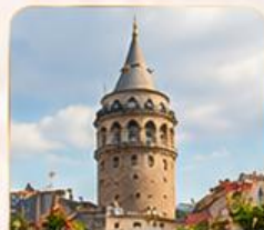
GALATA TOWER หอคอยกาลาตา