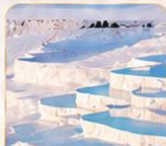
PAMUKKALE ปานุกคาล่า