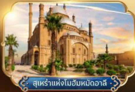
สุเหร่าแห่งโมฮัมหมัดอวาลี