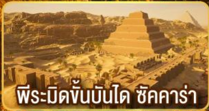
พีระมิดขั้นบันได ชิคคาร์่า