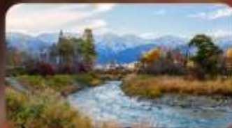
โออิเดะปาร์ค