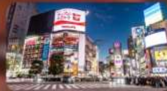
ซ้อปิ้งชินจูกุ