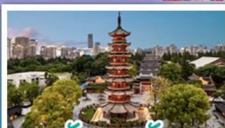
วัดหลงหัว