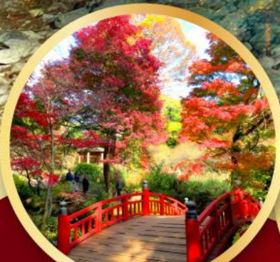
สวนดอกบ๊วยอาคามิ