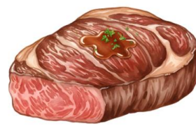
● เนื้อหมู