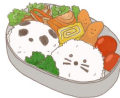
● อาหารสำหรับเด็ก ( 2-11 ปี ) *วัตถุดิบขึ้นอยู่กับทางร้าน