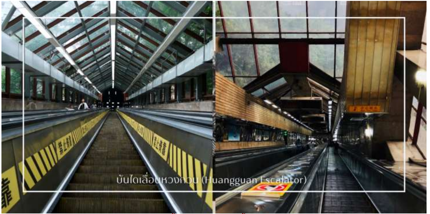
บันไดเลื่อนหวงกวน (Huangguan Escalator)

เที่ยง บริการอาหารเที่ยง ณ ภัตตาคาร (มื้อที่8) เมนูพิเศษ : สุกี้หม่าล่า