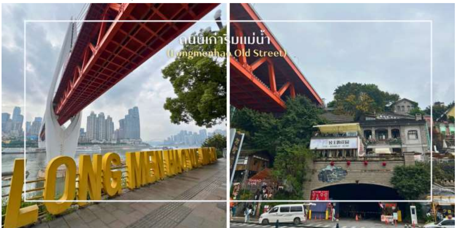
ถนนเก่าริมแม่น้ำ (Longmenhao Old Street)

นำท่านสู่ ถนนโบราณหลงเหมินฮ่าว (Longmenhao Old Street) ถนนเก่าริมแม่น้ำอีกหนึ่งแลนด์มาร์กสำคัญของเมืองฉงชิ่ง ถนนสายนี้เคยเป็นย่านการค้าและศูนย์กลางเศรษฐกิจที่รุ่งเรืองในยุคราชวงศ์หมิงและชิง ปัจจุบันได้รับการอนุรักษ์ไว้อย่างดี เพื่อเป็นแหล่งเรียนรู้ทางประวัติศาสตร์ และแหล่งท่องเที่ยวเชิงวัฒนธรรมที่เต็มไปด้วยเสน่ห์บรรยากาศของถนนยังคงอบอวลไปด้วยกลิ่นอายวันวาน อาคารบ้านเรือนแบบโบราณผสมผสานกับร้านค้า ร้านอาหาร และแกลเลอรีร่วมสมัยอย่างลงตัว อีกทั้งยังเป็นจุดชมวิวแม่น้ำที่โดดเด่น สามารถมองเห็นสะพานข้ามแม่น้ำแยงซีและทัศนียภาพของเมืองฉงชิ่งในมุมที่สวยงาม และอีกหนึ่งจุดหมายที่สะท้อนเสน่ห์ดั้งเดิมของที่นี่คือ Xiahaoli Old Street ตรอกซอกซอยแคบ ๆ บันไดหิน และสถาปัตยกรรมไม้โบราณที่ยังคงกลิ่นอายของวิถีชีวิตในอดีต แม้ในปัจจุบันจะได้รับการบูรณะและพัฒนาให้เหมาะกับการท่องเที่ยว ก็ยังคงรักษาบรรยากาศคลาสสิกเอาไว้ได้อย่างดี