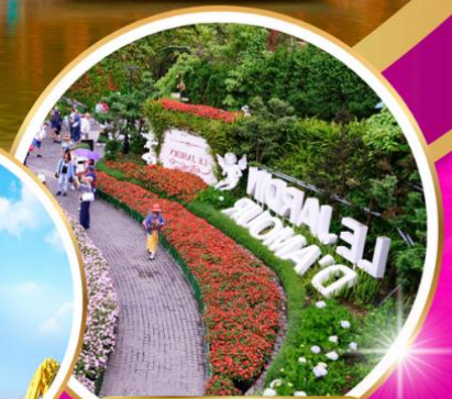
Le Jardin d'Amour