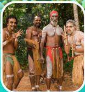
Rainforestation Aboriginal Show