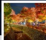
อุโมงค์เมบิล