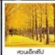
สวนเอ็กซ์โป