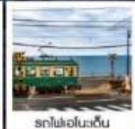
รถไฟโอโนะเด็น