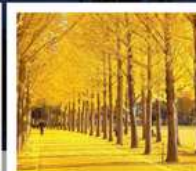
สวนเอ็กซ์โป