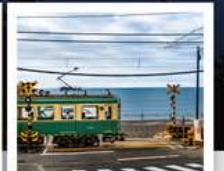
รถไฟโอบะเด็น