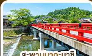
สะพานนากะบาชิ ทาคายาม่า