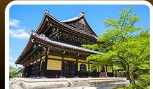
วัดนันเซ็นจิ