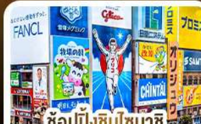
ช้อปปิ้งชินโซบาชิ และโดตงโมริ