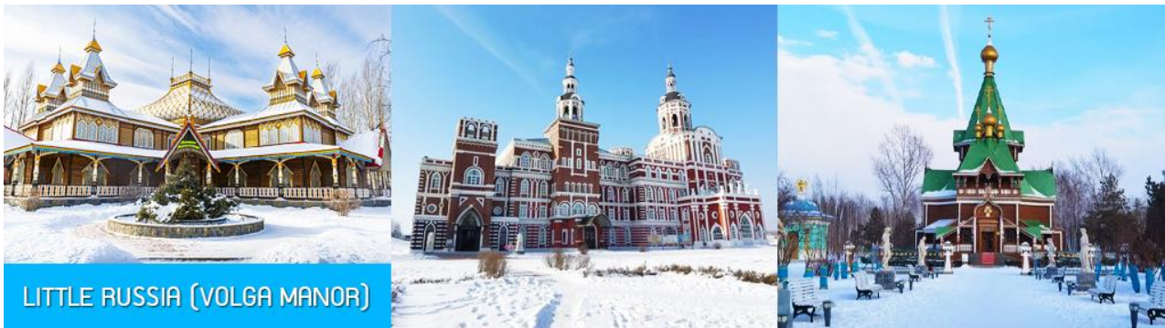
LITTLE RUSSIA (VOLGA MANOR)

รับประทานอาหารเช้า ณ ห้องอาหารของโรงแรม (13)