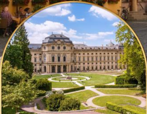
พระราชวังแวร์ซายส์ ฝรั่งเศส