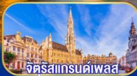
จัตุรัสแกรนด์เพลส