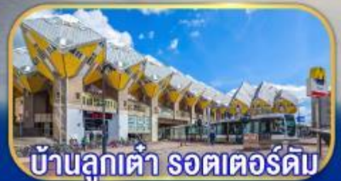
บ้านลูกเต่า รถเตอร์ดัม

เยือนเมืองเก่าแก่ยุโรป เกือบไฮไลต์กลุ่มประเทศเบเนลักซ์ กับการบินไทย บินตรงอัมสเตอร์ดัม