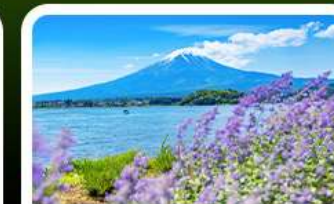
สวนโอบิชิ ปาร์ค