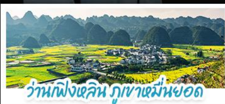
ดงผิงเหลิน ภูเขาเขม่านยอด