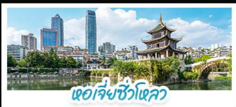
หอเจียงซิวโหลว

ผ่านชมสะพานหุบเขาฮวาเจียง สะพานแขวนที่สูงที่สุดในโลก ชมปราสาทลับคีสึนยี XINGYI JILONGBAO CASTLE แห่งมณฑลกุ้ยโจว น้ำตกหวงกู่ซู่ (รวมบันไดเลื่อน) • ชมหอเจียงซิวโหลว (JIAXIU TOWER) สัญลักษณ์และแลนด์มาร์กสำคัญของเมืองกุ้ยหยาง มณฑลกุ้ยโจว