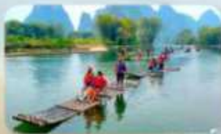
ล่องแพไม้ไผ่ที่ทง