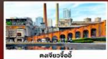
ตงเจียวจ้ออ๋