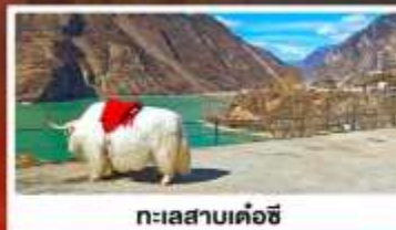
ทะเลสาบเค่อซี