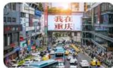
ถนนอาหารถวนอันเฉียว