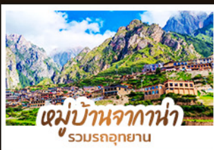
หมู่บ้านจากกาน่า รวมรถอุทยาน