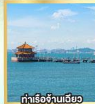
ท่าเรือจันทิว