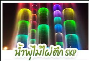
น้ำพุไม้ไผ่ตึก SKP

ภูเขาสี่ดรุณี • อุทยานหวงหลง • เมืองโบราณซงพาน • ทะเลสาบเต๋อซี อุทยานจิวจ้ายโกว • จัตุรัสหย่างเทียนหู่ • รูปปั้นหมีแพนด้าเซลฟี ถนนโบราณชอยกวางชอยแคบ • ถนนคนเดินไท่กู่หลี่ • ถนนคนเดินซุนซี แพนด้ายักษ์ปิ่นตึก ณ ตึก IFS • วัดต้าฉี • น้ำพุไม้ไผ่ตึก SKP