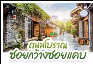
ถนนโบราณ ชอยกวางชอยแคบ