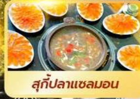
สุกี้ปลาแซลมอน