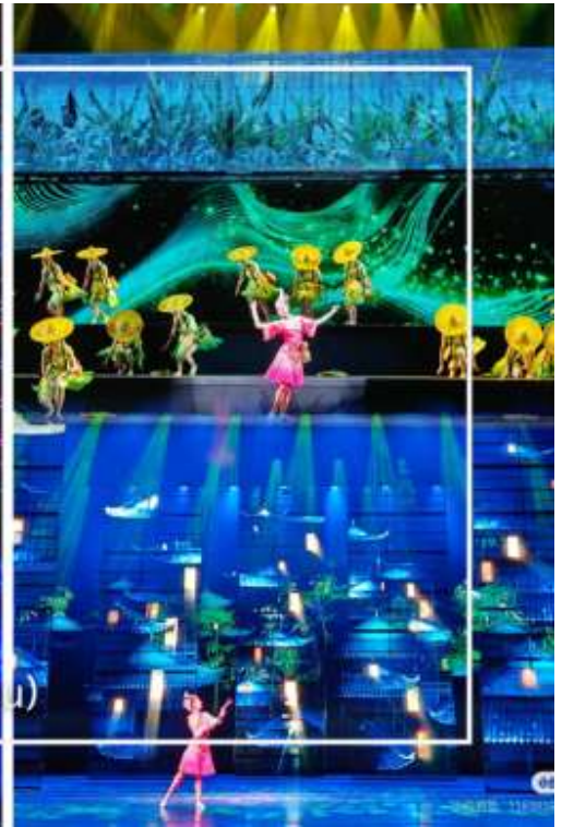
การแสดงโชว์ซีลิ่งคาปู (Xilan Kapu)

เดินทางเข้าโรงแรมที่พัก Xiazhou Hotel ระดับ 4 ดาวหรือเทียบเท่า