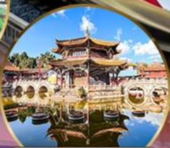
วัดหยวนทอง