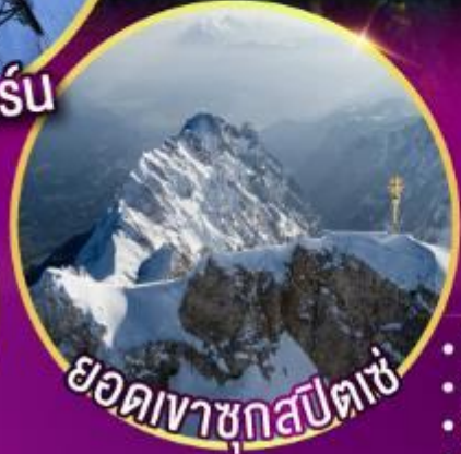
ยอดเขาชุกสปีตเซ