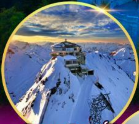
ยอดเขาซิลรอร์น