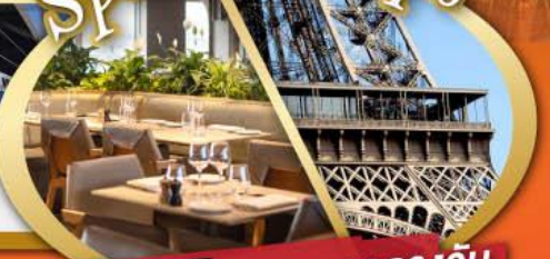
รับประทานอาหารกลางวัน บนหอไอเฟล

ไฮไลท์ในโปรแกรม • สะพานไมซ์าเปล ลูเซิร์น