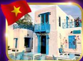
คาเฟ่สุดชิค ชานทรา มาริน่า