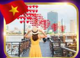
เช็คอินสะพานแห่งความรัก