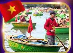
เรือกระด้ง หมู่บ้านกิมกาน