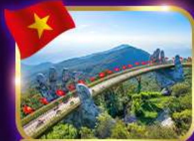
สะพานมือสีทอง บานาฮิลล์