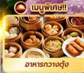
เมนูพิเศษ!! อาหารกวางตุ้ง