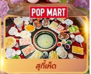
POP MART สุกี้เห็ด