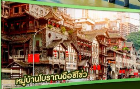
หมู่บ้านโบราณฉือฮิว