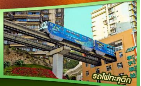
รถไฟฟ้าลัด