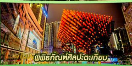
พิพิธภัณฑ์ศิลปะตะเกียบ