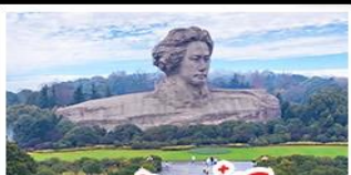
เกาะสิ่มจวีจี้โจว