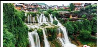
เมืองโบราณฝูเจียง