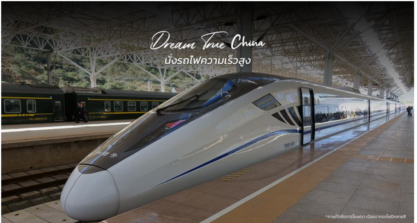
*ภาพใช้เพื่อการโฆษณา เมืองจากรถไฟหลายสี

**ขบวนรถไฟอาจมีการเปลี่ยนแปลง** หมายเหตุ: เพื่อความสะดวกในการเดินทางของท่าน ทางบริษัทฯจะนำกระเป๋าเดินทางของท่านขึ้นรถบัส โดยท่านถือเฉพาะสิ่งของสำคัญ และจำเป็นต้องขึ้นรถไฟความเร็วสูงเท่านั้น รถบัสจะนำกระเป๋าเดินทางของท่านไปจัดเตรียมไว้ที่โรงแรม